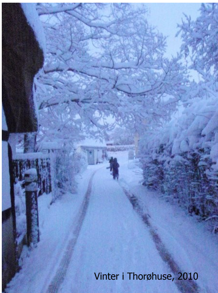
Vinter i Thorøhuse, 2010